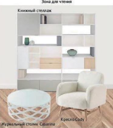
Зона для чтения