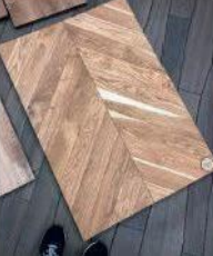
Инженерная доска «ёлочка»