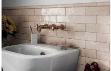
Плитка на фартук Equipe Artisan, референс